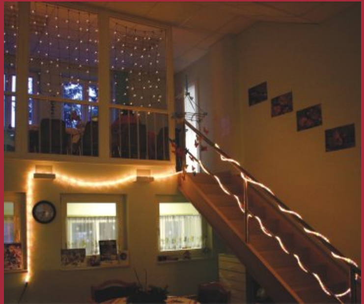
Stimmungsvolle Beleuchtung im Babyzimmer der Klinik für Frauenheilkunde und Geburtshilfe