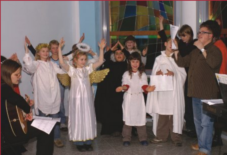
Weihnachtsspiel von Schülern der Martinschule im Raum der Stille