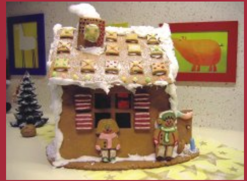
Süße Dekoration in der Onkologie der Klinik für Kinder- und Jugendmedizin