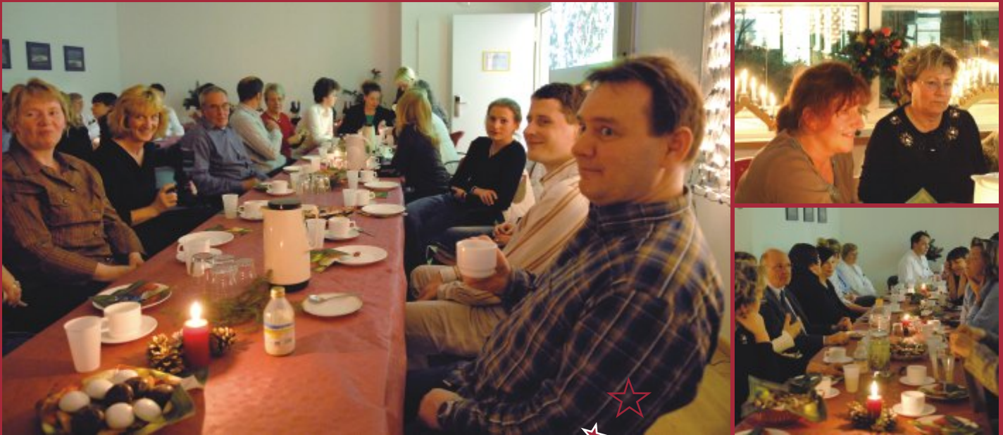
Weihnachtsfeier der Klinik für Augenheilkunde