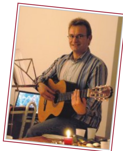
Autor: Dr. Clemens Jürgens, Klinik und Poliklinik für Augenheilkunde

Dann wedelt der Weihnachtsmann noch kurz mit seiner goldenen Ruprecht Express Kreditkarte und verschwindet auf seinem Schlitten am Weihnachtshimmel. Zufrieden stehe ich zusammen mit allen Mitarbeitern vor der Notaufnahme, um dem Weihnachtsmann hinterher zu winken. Auf diese Weise hat das Universitätsklinikum Greifswald das Weihnachtsfest gerettet, denn zu Hause liegen unsere richtigen Geschenke schon unter dem Weihnachtsbaum bereit.