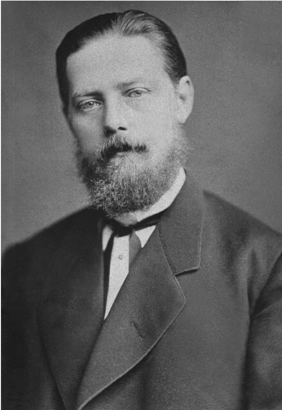
Foto des jungen Privatdozenten Dr. med. habil.