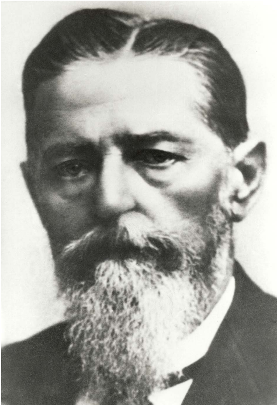
Foto des alten und von Krankheit gezeichneten Univ.-Prof. Dr. med.